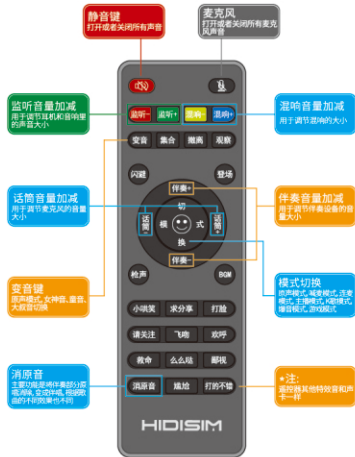
遥控器功能按键示意图